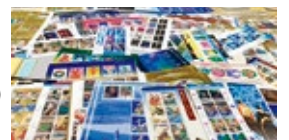
▲ 寄贈頂いた未使用切手